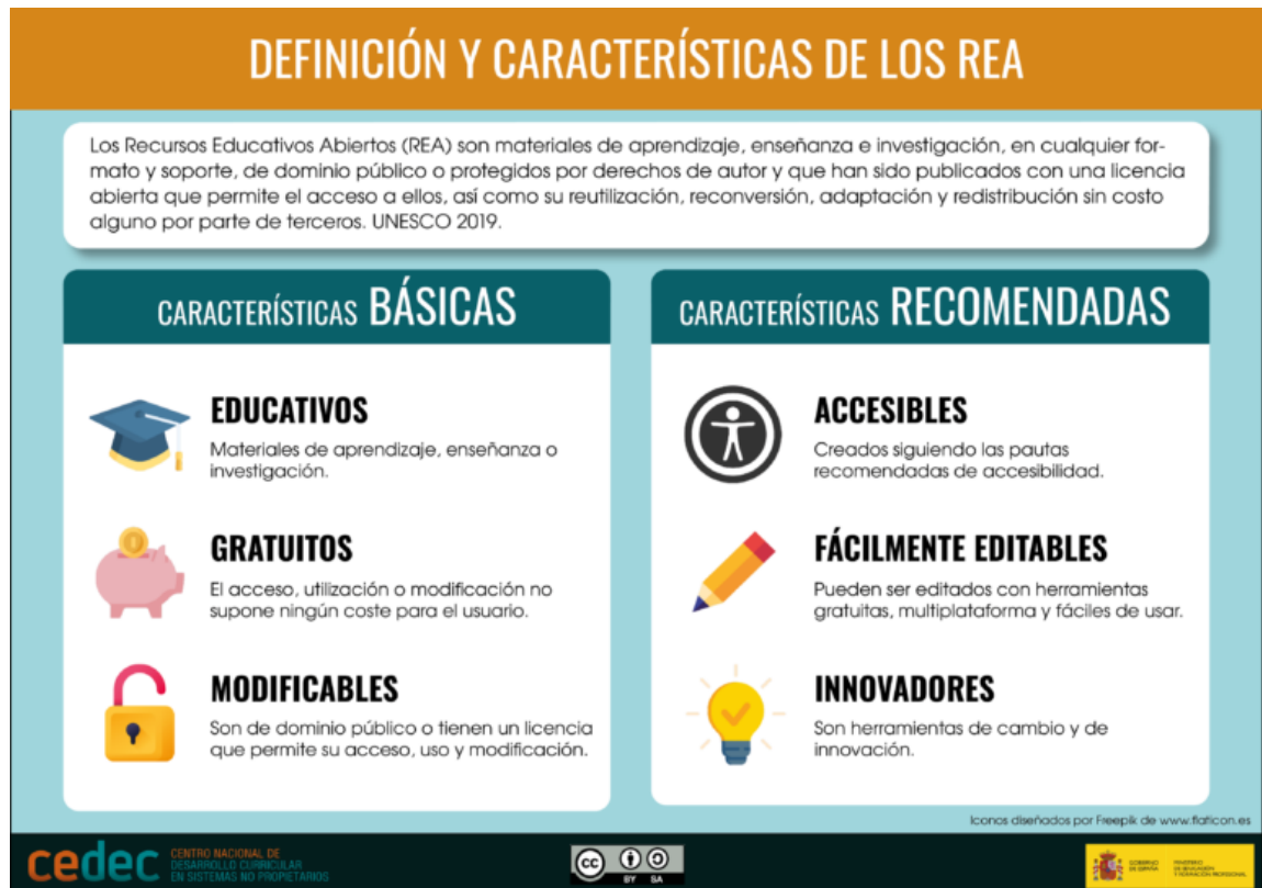
Figura 3. "Característiques dels recursos educatius oberts" de CEDEC. INTEF. https://cedec.intef.es/recursos/?buscador=infografias . Llicència CC BY-SA 4.0