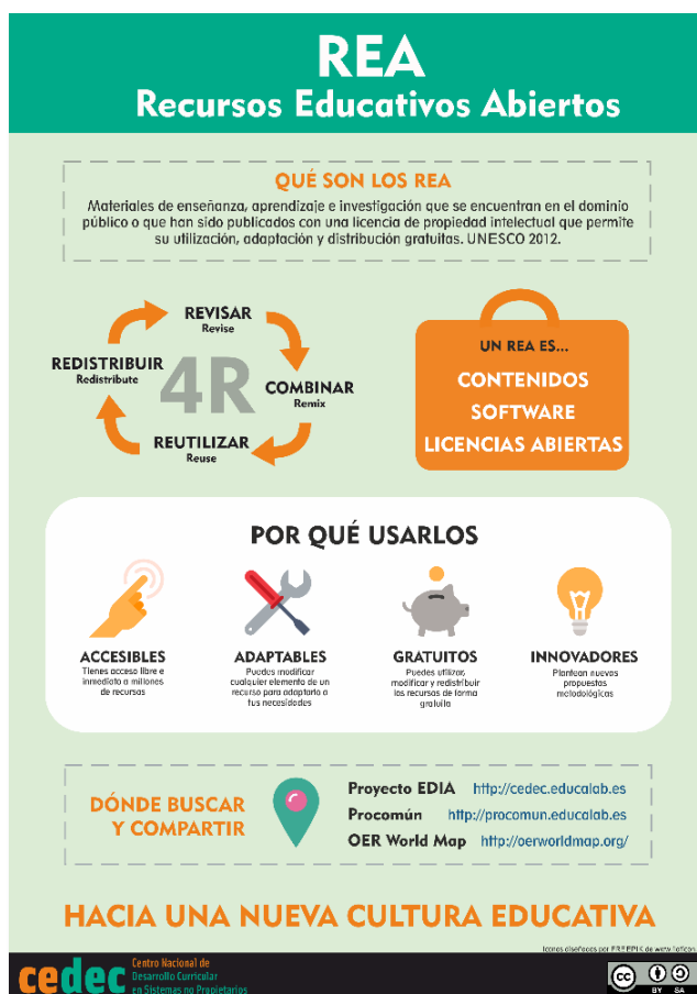
Figura 2. "Què són els recursos educatius oberts" de CEDEC. INTEF. https://cedec.intef.es/recursos/?buscador=infografias . Llicència CC BY-SA 4.0

Els Recursos Educatius Oberts (REO) són materials d'ensenyament, formatius o d'investigació en qualsevol suport, digital o de qualsevol altre tipus, que segueixen de domini públic o que hagen estat publicats baix una llicència oberta que permeta l'accés gratuït, així com l'ús, modificació i redistribució per altres sense cap restricció o amb restriccions limitades. (UNESCO 2012)